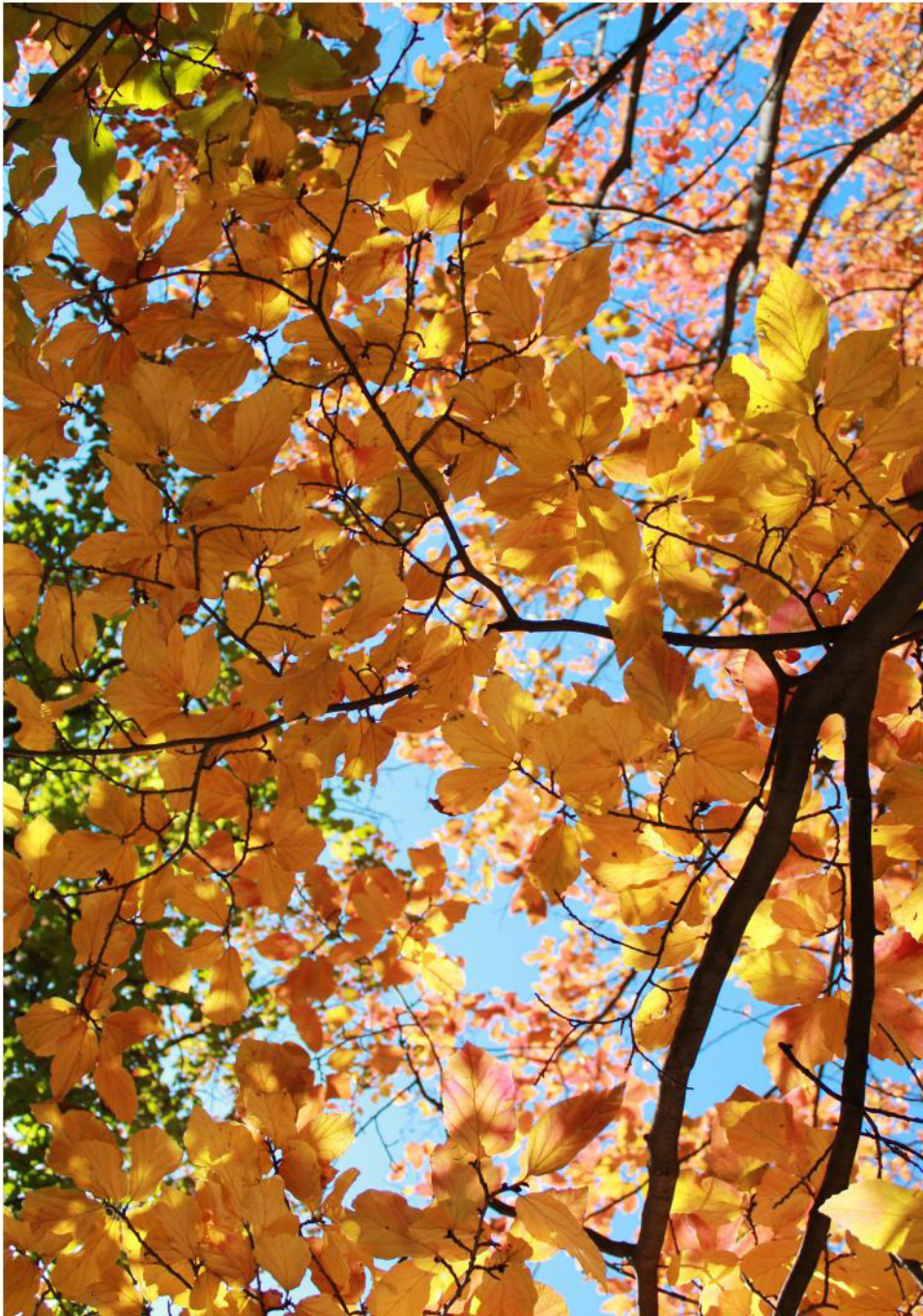
*Fotografía tomada en una de las visitas a jardines de la edición pasada del Curso de Paisajismo y Jardinería de Dmad.